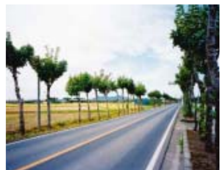
▲門田ハザ並木 中之口