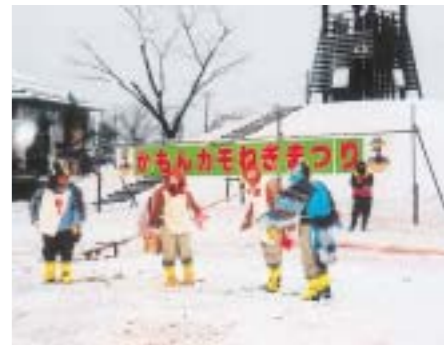
▲かもん!カモねぎまつり 湯東