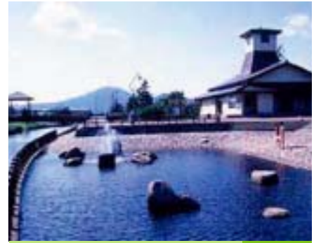
▲西川ふれあい公園 西川